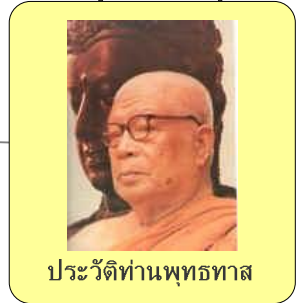
ประวัติท่านพุทธทาส

อ้างอิงข้อมูลจาก www.buddhadasa.com เขียนแผนที่ความคิดโดย ภก.ประชาสารณ์ แสนภักดี