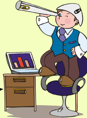
มีวิสัยทัศน์