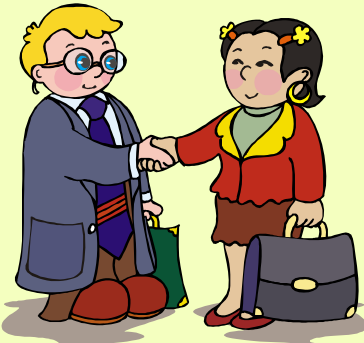
ชื่อเสียงมีคุณธรรม