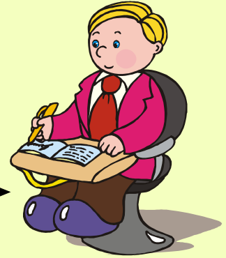
กล้าตัดสินใจ