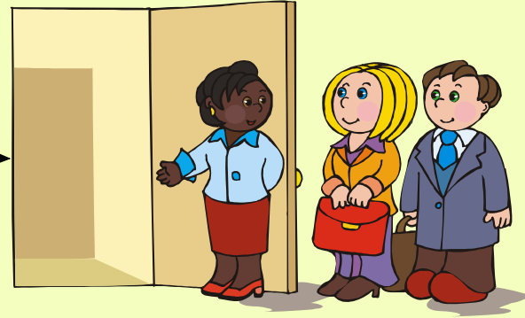
สามารถจูงใจผู้อื่นได้