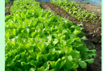
ชมรมกลีกรมธรรมชาติ