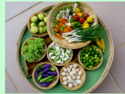
กินเป็นเน้นผัก ผักครึ่งหนึ่ง อย่างอื่นครึ่งหนึ่ง