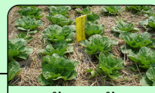
ผักอนามัย (pesticide safe)