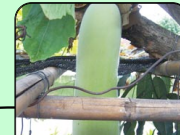
ผักไร้สารพิษ