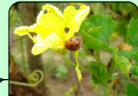
ผักอินทรีย์ (Organics)