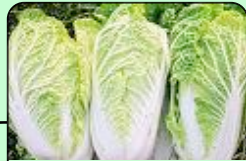
ผักปลอดสารพิษ (pesticide safe)