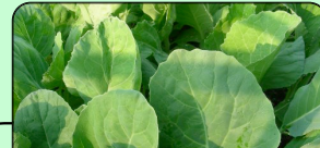
ผักปลอดภัยจากสารพิษ (pesticide safe)