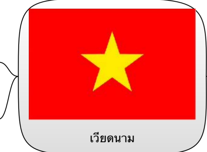
เวียดนาม

สีแดง : การต่อสู้เพื่อเอกราชของชาวเวียดนาม (ปัจจุบัน : การปฏิวัติโดยชนชั้นกรรมาชีพและ ความสำเร็จรุ่งเรือง)