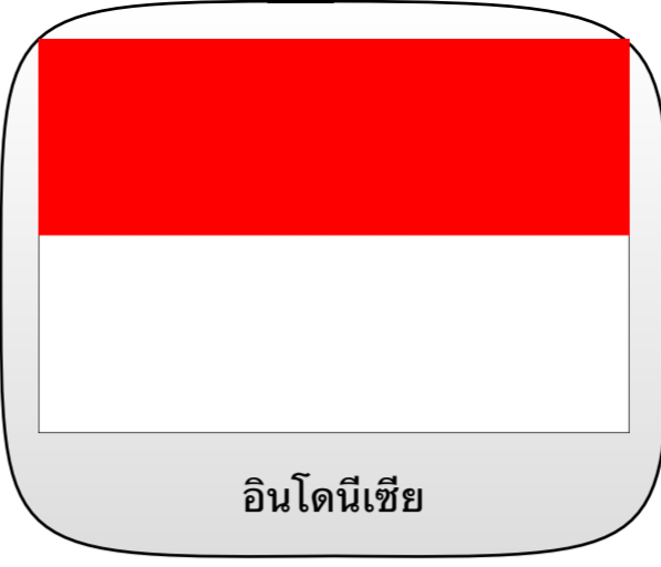
อินโดนีเซีย