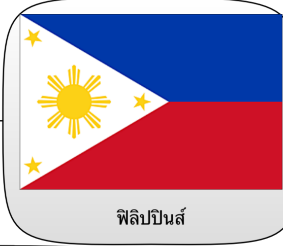
ฟิลิปปินส์

สีน้ำเงิน : สันติภาพ สัจจะ และ ความยุติธรรม