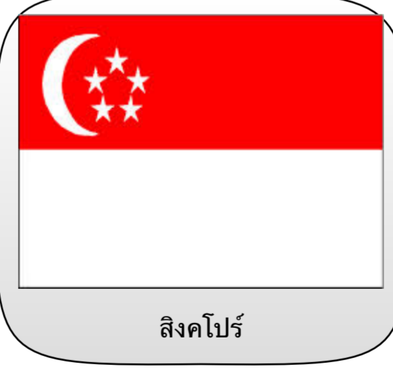
สิงคโปร์

ดาวสามดวง : การแบ่งพื้นที่ภูมิศาสตร์ของประเทศ ออกเป็น 3 ส่วนใหญ่ๆ ได้แก่ เกาะลูซอน เกาะมินดาเนา และหมู่เกาะวิซายัส