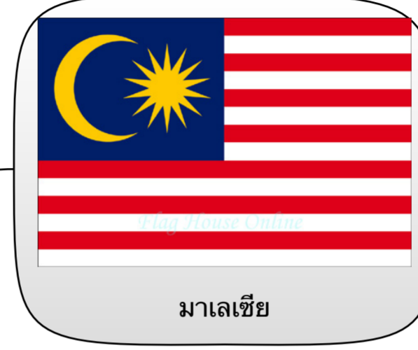
มาเลเซีย