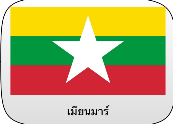
เมียนมาร์

ดาวสีขาวห้าแฉก : สหภาพอันมั่นคงเป็น เอกภาพ